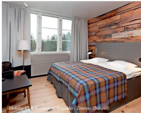
Holiday Club Kuusamon Tropiikki - Zimmer (Beispiel)